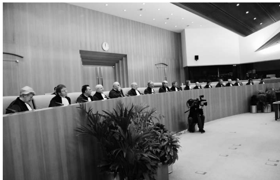
EG-domstolens rättssal i Luxemburg. Här 156 mil från Vaxholm avgjordes Laval-målet.

Eftersom det är en grundlagsändring krävs tre fjärdedelsmajoritet i riksdagen för att fördraget ska godkännas. Socialdemokraterna kan med sina 130 ledamöter på egen hand tvinga regeringen att begära och få ett juridiskt bindande undantag.